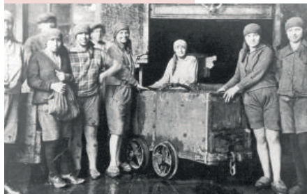
Arbeiterinnen in Penzberg