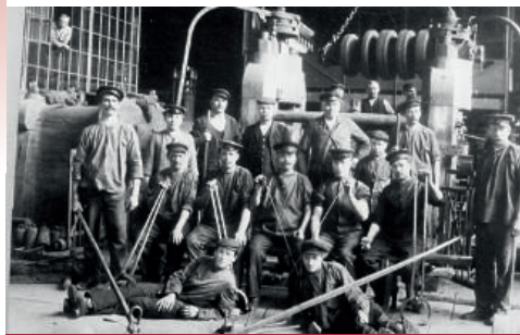
Arbeiter in der Maxhütte

Die AWO finanzierte ihre Aktivitäten mit Spendensammlungen, ab 1925 auch mit einer eigenen Lotterie sowie Wohlfahrtsmarken. Vorsitzende der AWO war bis 1933 Marie Juchacz. Nach der Machtübernahme der Nationalsozialisten 1933 wurde die Arbeiterwohlfahrt wie alle anderen sozialdemokratischen Vereinigungen verboten.