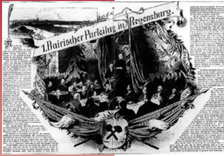
Geburtsstunde der bayerischen Sozialdemokratie

Am 26. Juni 1892 fand in Regensburg der erste Landesparteitag der bayerischen Sozialdemokraten statt. Die Delegierten verabschiedeten ein Wahlprogramm für die Landtagswahlen im darauf folgenden Jahr. Dieser Parteitag gilt als die Geburtsstunde der bayerischen SPD. Von da an wurden alle zwei Jahre Parteitage abgehalten, aufgrund der bayerischen Vereinsgesetze konnte aber erst 1898 formal eine Landesorganisation gebildet werden.