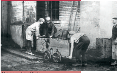
Arbeiterinnen im Bergwerk Penzberg

Mit den Unternehmen entstand an diesen Orten ein »Arbeiterstand«, auch »Vierter Stand« genannt und später »Arbeiterklasse«.