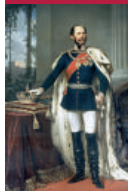
König Max II.

Im 19. Jahrhundert waren die Arbeiter weitgehend ungeschützt der Ausbeutung durch die Arbeitgeber ausgesetzt. Extrem lange Arbeitszeiten von 12–14 Stunden täglich und uneingeschränkte Kinderarbeit waren die Regel. Schutzbestimmungen existierten nicht. Das änderte sich erst mit der Gewerbeordnung von 1869. Die regelmäßige Beschäftigung von Kindern unter 12 Jahren wurde verboten, ebenso die Sonntags-, Feiertags- und Nachtarbeit von Jugendlichen unter 16 Jahren. Kinder von 12 bis 14 durften höchstens 6 Stunden täglich arbeiten, junge Menschen von 14 bis 16 höchstens 10 Stunden.